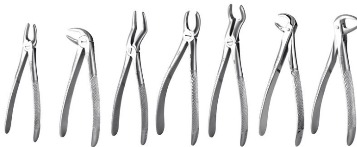
n°1 n°33A n°51 n°65L n°67A n°73 n°74